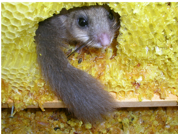
Fig. 2