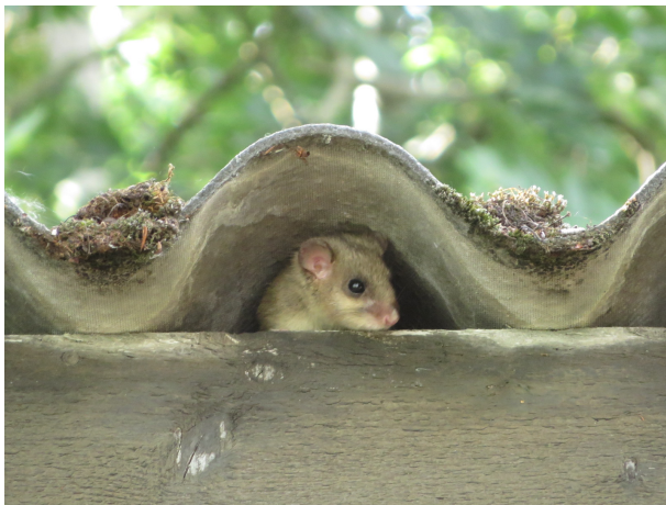
Fig. 1

Les photos ci-dessous sont disponibles pour une utilisation en lien avec ce communiqué de presse et avec mention correcte des auteurs à titre gratuit. À télécharger sur : http://nosvoissinsauvages.ch/presse (en double cliquant sur l'image).