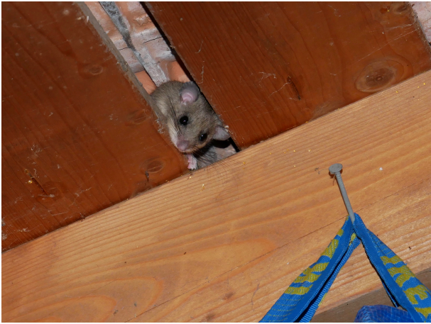
Fig. 4