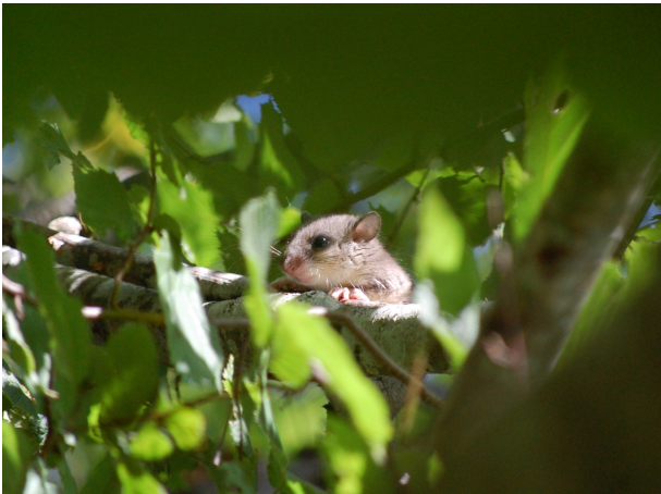
Fig. 5