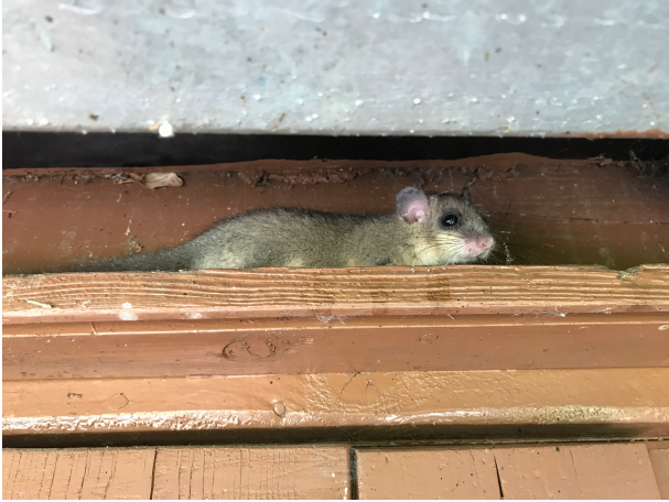
Fig. 3